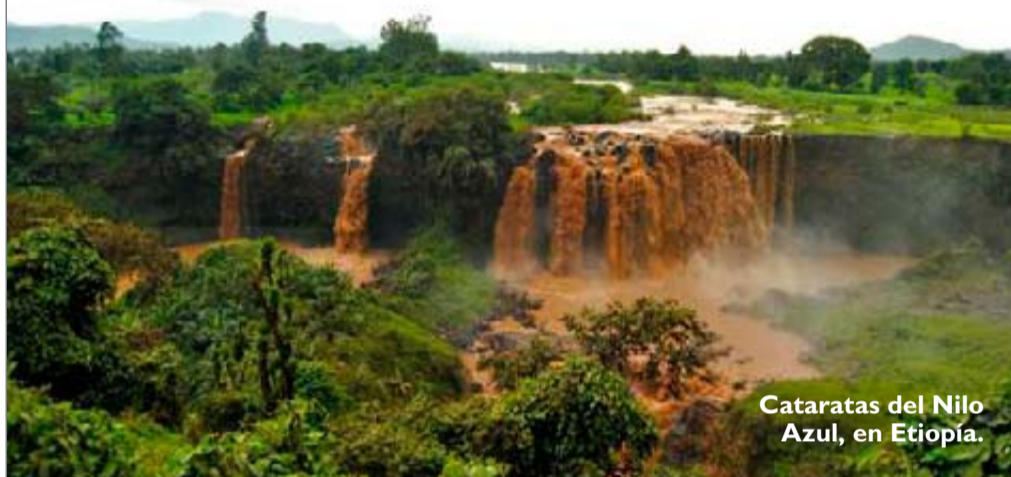
Cataratas del Nilo Azul, en Etiopía.

para empaparse de la cultura tanzana. Realizarán safaris en todoterreno a través de uno de los territorios más salvajes del continente africano, en especial la reserva de Selous, para admirar los paisajes y riqueza animal de este destino. www.nuba.net .