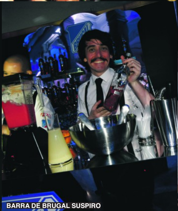
BARRA DE BRUGAL SUSPIRO