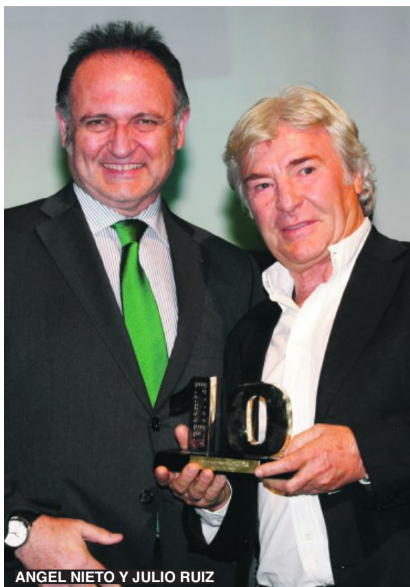
ÁNGEL NIETO Y JULIO RUIZ