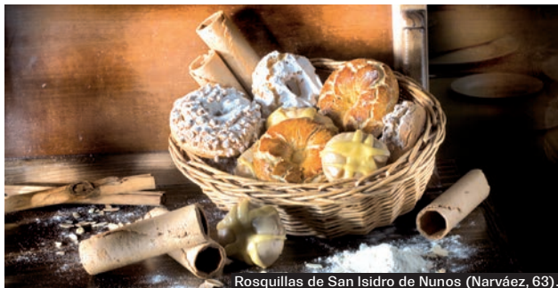
Rosquillas de San Isidro de Nunos (Narváez, 63).