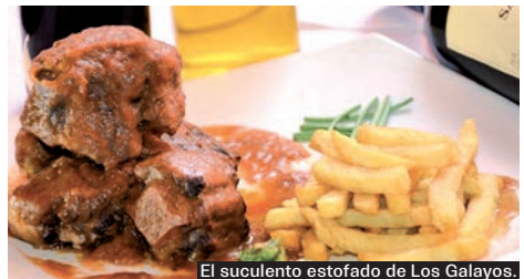
El suculentto estofado de Los Galayos.

Una serie de restaurantes que suelen ofrecer en su carta rabo de toro se unen para ofrecer hasta el 31 de mayo un menú compuesto de primer plato, plato de rabo de toro, postre y una bebida por 25 euros+ IVA. Los más de 20 restaurantes participantes (como Los Galayos o Velázquez 128) pueden consultarse en www.mesdelrabodetoro.com