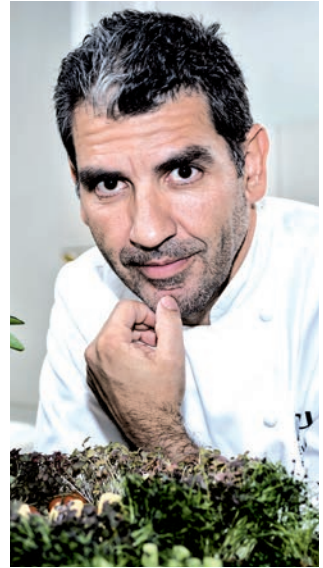
Paco Roncero junto a la Sala Alcalá, en la que ofrecerá sus menús durante la feria de San Isidro.

ocio. Del apartado culinario se encarga nada menos que el prestigioso chef Paco Roncero , distinguido con dos estrellas Michelin por su trabajo al frente de la Terraza del Casino. Roncero ha preparado 12 menús en los que realiza un recorrido por sus propuestas más arraigadas en nuestra tradición , siempre tamizados por su irrenunciable toque innovador y con la vista puesta en el referente taurino. Los menús se servirán a mediodía (a un precio de 75 euros; reservas en el tel. 634 578 770) en la Sala Alcalá, ubicada bajo el tendido 9 y que ha sido redecorada para la ocasión por el ilustrador Andi Rivas recreando con las técnicas más contemporáneas los vistosos y típicos azulejos andaluces.