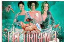
» CHIRIGÓTICAS EL ORIGEN EN EL TEATRO MARAVILLAS - ENTREVISTA 02 Oct 2014 0 comentarios Nos acercamos al Teatro Maravillas de Madrid para entrevistar a "Chirigóticas", una de las compañías de teatro dedicadas al humor, clave en el...