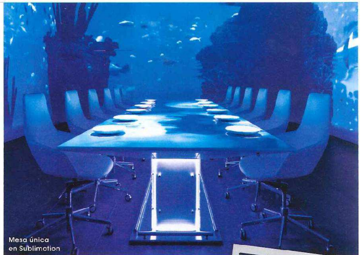
Mesa única en Sublimotion