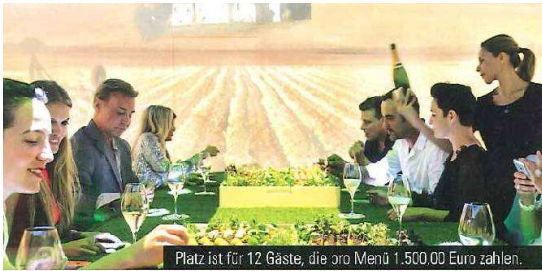
Platz ist für 12 Gäste, die pro Menü 1.500,00 Euro zahlen.