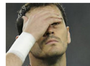
A Casillas le dan donde más le duele