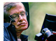
Hawking predice el fin del mundo