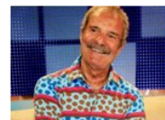
Increíble sueldo de Mariñas en Tómbola