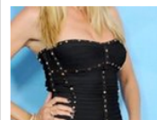
Con 40 años logró impactar así