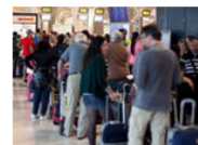
Todos abandonan España, menos ellos