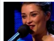
La 'mosquita muerta' que engañó a un país