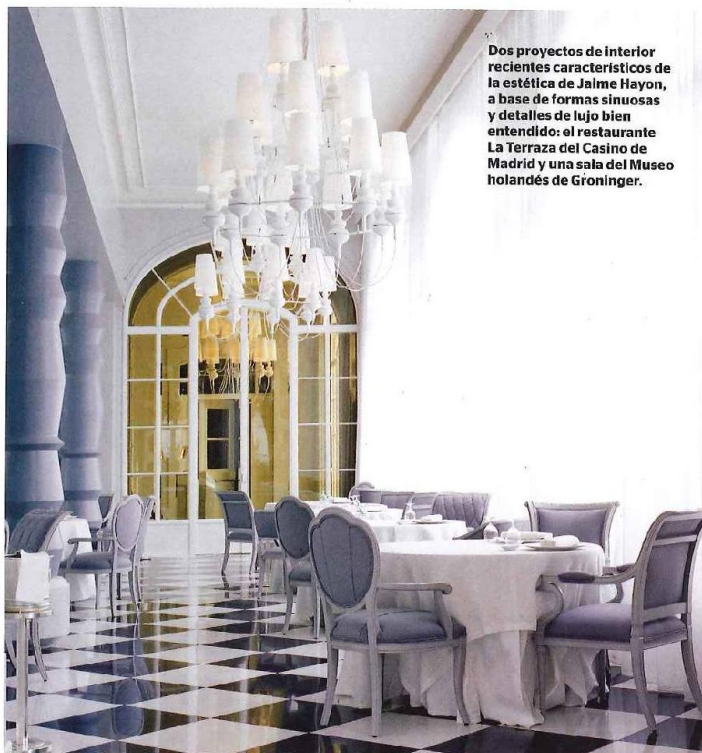
Dos proyectos de interior recientes característicos de la estética de Jaime Hayon, a base de formas sinuosas y detalles de lujo bien entendido: el restaurante La Terraza del Casino de Madrid y una sala del Museo holandés de Groninger.

Times Magazine incluyó Hayon como uno de los cien creadores más relevantes de nuestros tiempos y la revista Wallpaper le ha catalogado como uno de los diseñadores más influyentes de la última década.