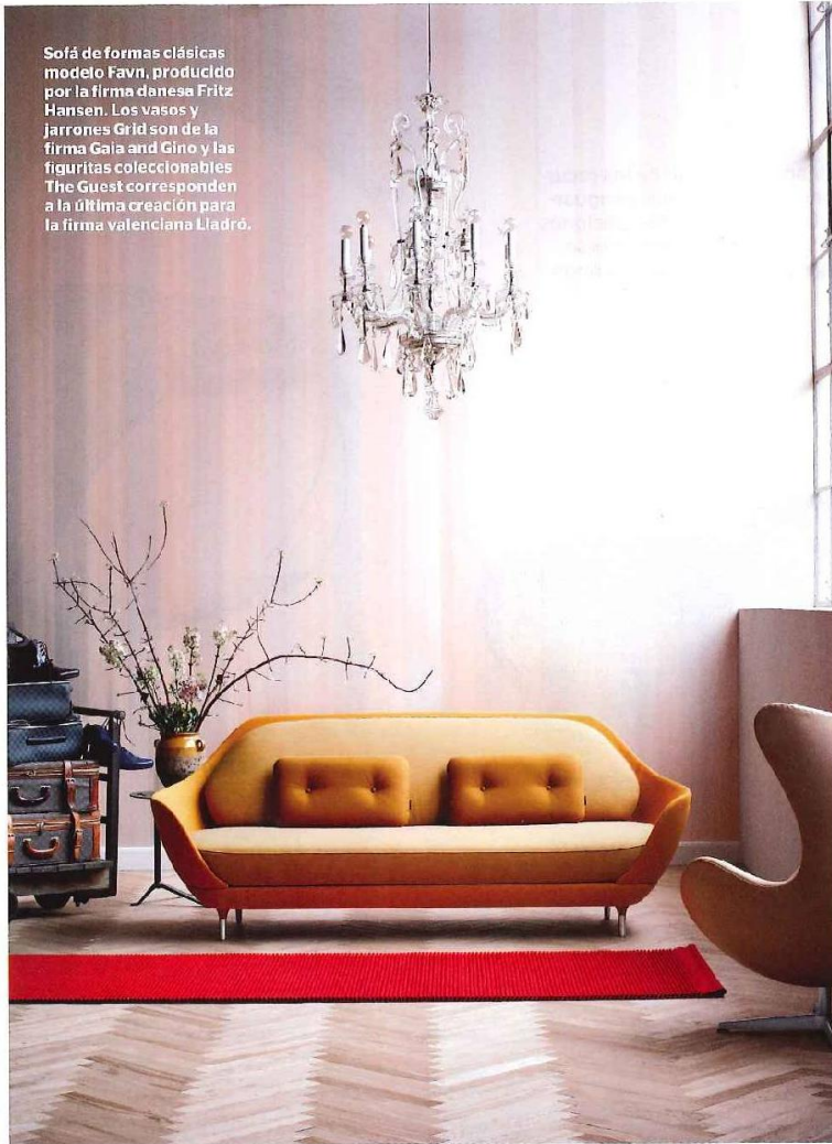
Sofá de formas clásicas modelo Favn, producido por la firma danesa Fritz Hansen. Los vasos y jarrones Grid son de la firma Gaia and Gino y las figuritas coleccionables The Guest corresponden a la última creación para la firma valenciana Lladró.