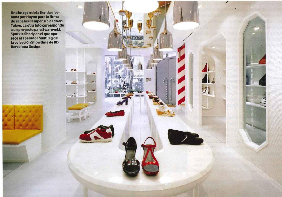
Una imagen de la tienda diseñada por Hayon para la firma de zapatos Camper, ubicada en Tokyo. La otra foto corresponde a un proyecto para Swarovski, Sparkle Shady en el que aparece el aparador Multileg de la colección Showtime de BD Barcelona Design.

ción de baño AQHayon, convertida en seguida en un best seller. Esta línea incluye un lavabo con espejo e iluminación incorporados, lleno de elegantes detalles semibarrocos y formas orgánicas. En la actualidad la comercializa la firma Bisazza. "Siempre me han gustado las formas orgánicas, suaves, en mis proyectos porque las encuentro más naturales. No creo en el diseño rígido, con ángulos. Creo que el cuadrado es una forma antinatural y por eso nunca lo utilizo. La producción artesana brinda sofisticación de la pieza. Cada persona es única, por lo tanto, si la mano toca la pieza ésta también lo será. Creo en el detalle, en las cosas bien hechas, en los materiales nobles y naturales. No soy un diseñador que busca el concepto en la materia, trabajo con los materiales naturales más conocidos, madera, cerámica, mármol."