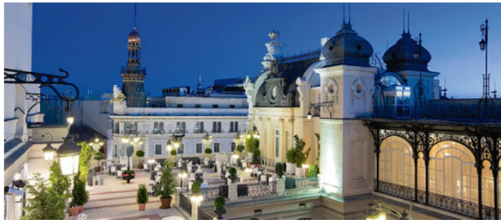
Cenar en el cielo de Madrid